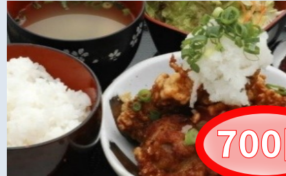
チキン南蛮とヘレカツ